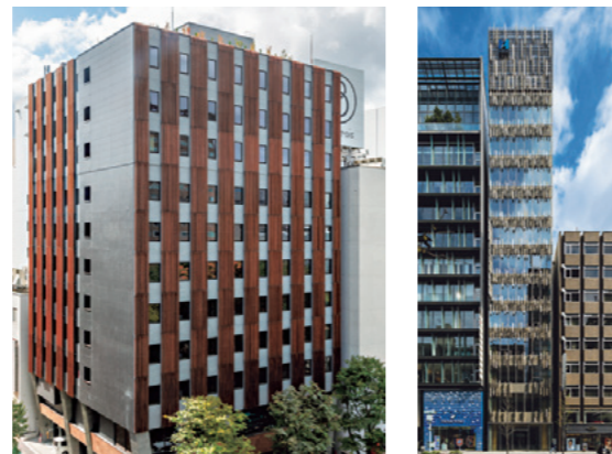
ザ ロイヤルパーク キャンパス 札幌大通公園