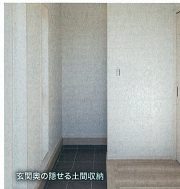
玄関奥の隠せる土間収納