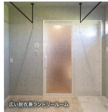
広い脱衣兼ランドリールーム

プライバシーを守りつつ、家事や育児を共有できる。敷地を効率的に使った間取りで様々な想いを考慮した、最適なヒノキヤならではのアイデア空間を感じてください。