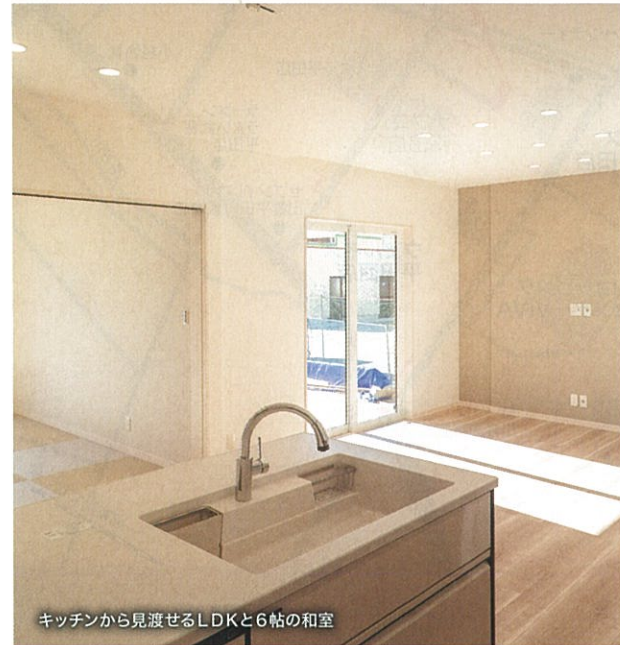
キッチンから見渡せるLDKと6帖の和室