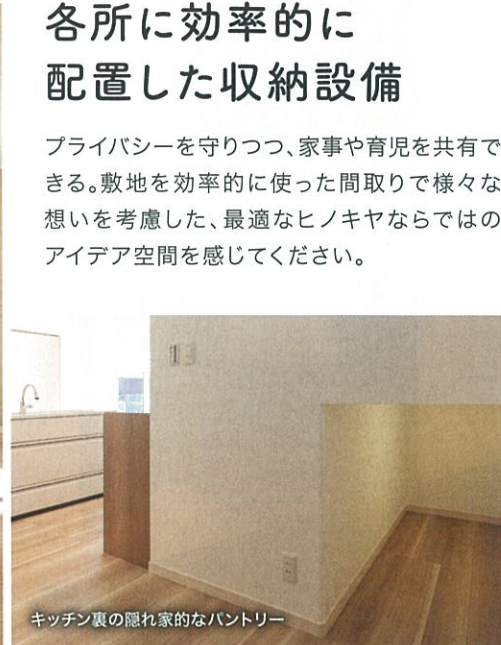
キッチン裏の隠れ家的なパントリー