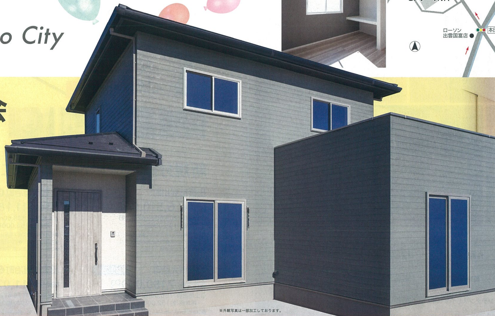
※外観写真は一部加工しております。

桧家住宅の木造注文住宅は、独自のこだわりで耐震性・耐久性・居住性等に優れています。また、下請け工務店を介さない直接施工により高いコストパフォーマンスを実現。地球環境の保全という大きなテーマに対して、貢献するべく「あらゆる人にエコで快適な住まいを」というミッションを策定し、「省エネECOハウス」の提供に注力しております。