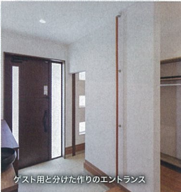
ゲスト用と分けた作りのエントランス