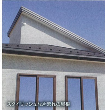
スタイリッシュな片流れの屋根