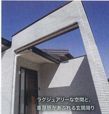
ラグジュアリーな空間と、重厚感があふれる玄関周り