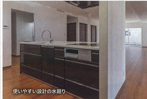
使いやすい設計の水廻り

プライバシーを守りつつ、家事や育児を共有できる。敷地を効率的に使った間取りで様々な想いを考慮した、最適なヒノキヤならではのアイデア空間を感じてください。