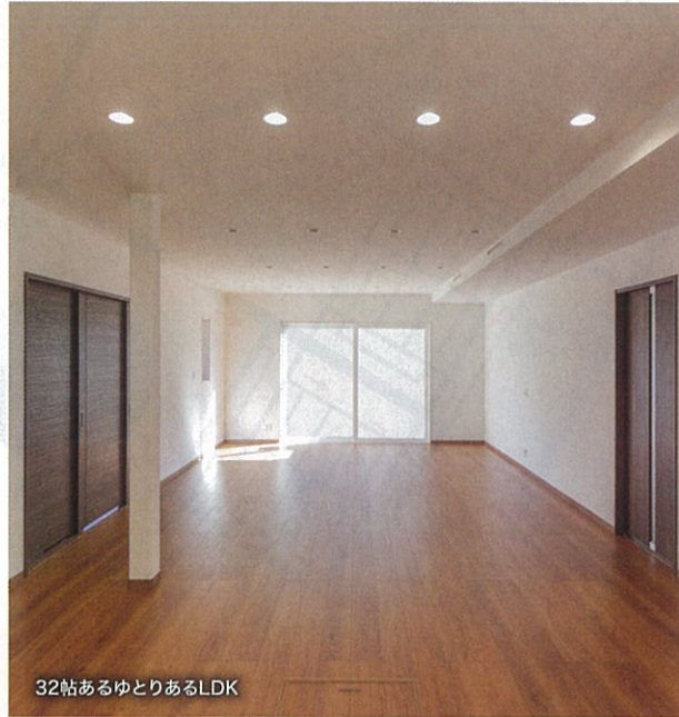
32帖あるゆとりあるLDK