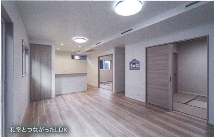
和室とつながったLDK