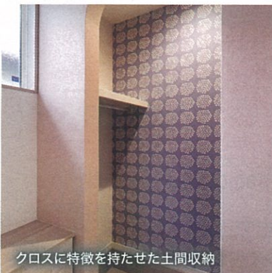
クロスに特徴を持たせた土間収納