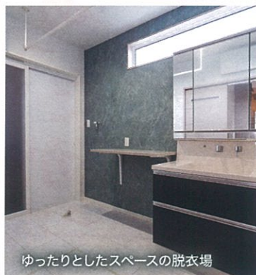
ゆったりとしたスペースの脱衣場

暮らしやすさを追求した「1階完結型」 プライバシーを守りつつ、家事や育児を共有できる。敷地を効率的に使った間取りで様々な想いを考慮した、最適なヒノキヤならではのアイデア空間を感じてください。