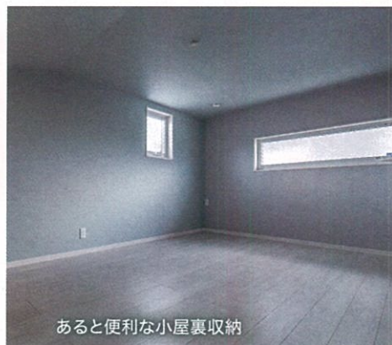
あと便利な小屋裏収納