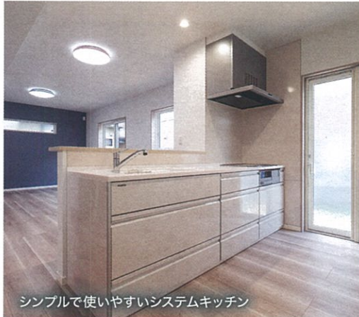
シンプルで使いやすいシステムキッチン