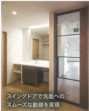
スイングドアで洗面へのスムーズな動線を実現