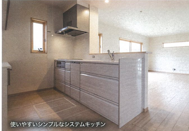
使いやすいシンプルなシステムキッチン