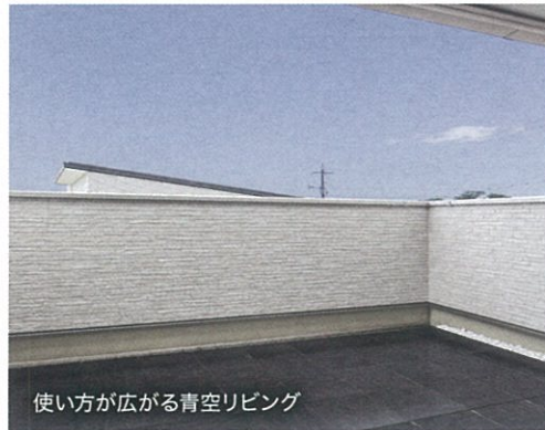
使い方が広がる青空リビング