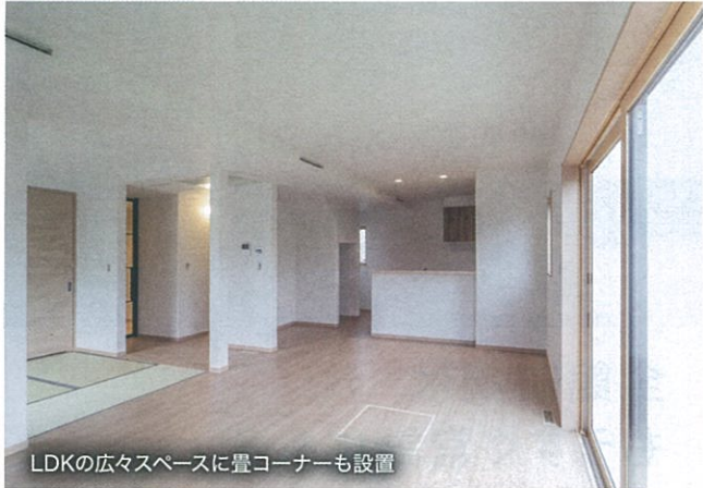
LDKの広々スペースに畳コーナーも設置