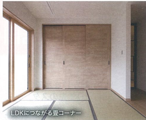
LDKにつながる畳コーナー