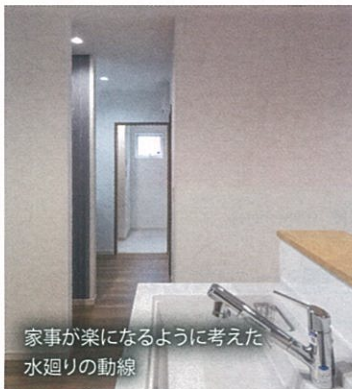
家事が楽になるように考えた水廻りの動線