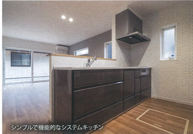
シンプルで機能的なシステムキッチン