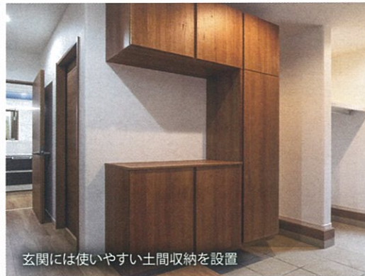
玄関には使いやすい土間収納を設置