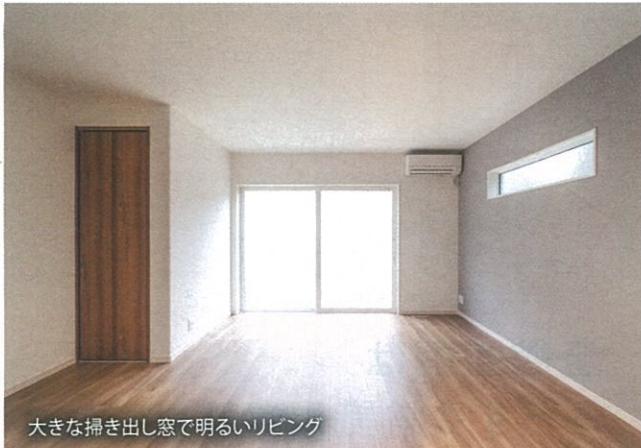
大きな掃き出し窓で明るいリビング