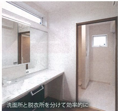
洗面所と脱衣所を分けて効率的に